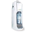
Gasatore per l'acqua (senza bombola gas)