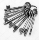
Chiavi in metallo